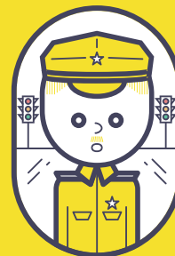
badge your function