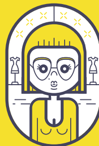
badge your style