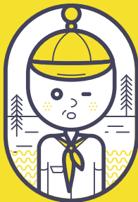
badge your moments